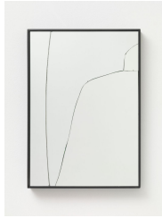
Alek O. Zig Zag 2016 Mirror fragment and mirror cuts 42 × 30 cm MS-ALE-001